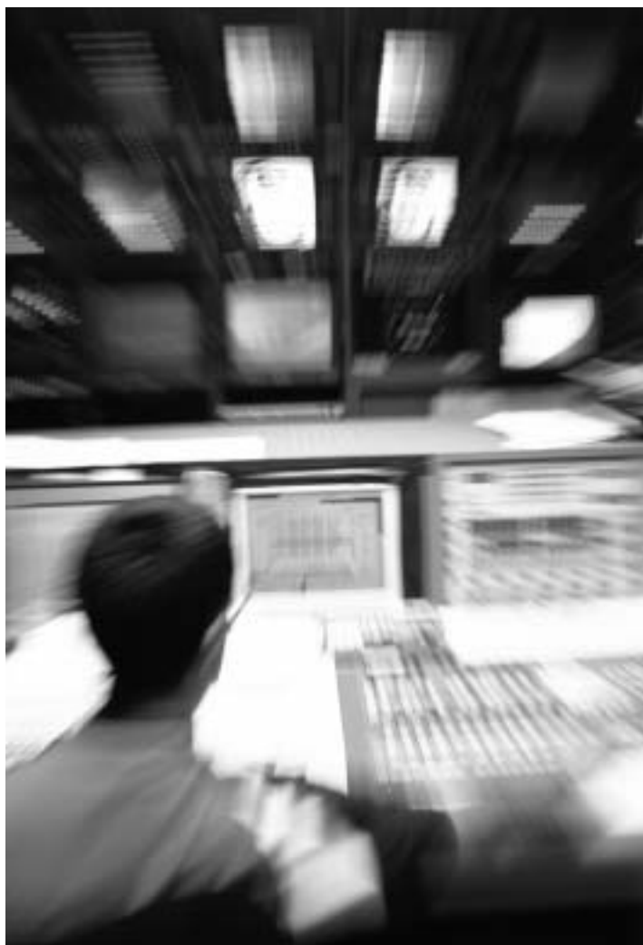
Telebista bateko estudioa. Interneti esker errazagoa da telebista propioa izatea.

L. SAINZ. Ba niri hori asko iruditzen zait.