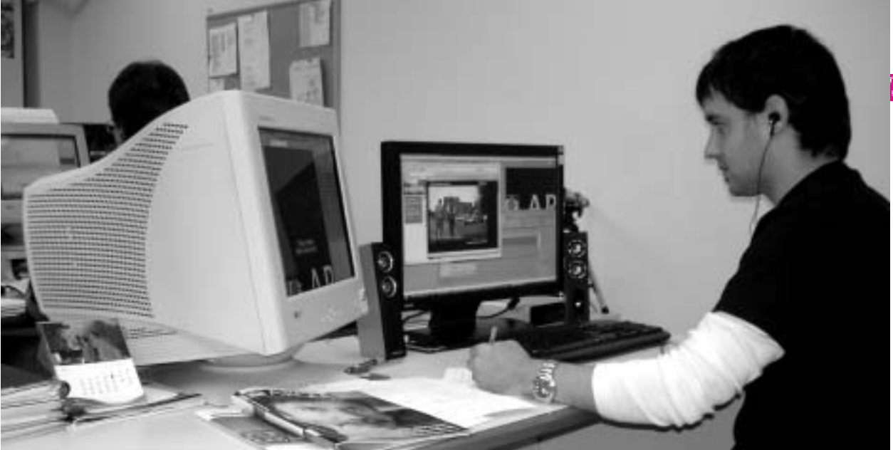
ARGIAko kazetaria erredakzioan, bideoak egiten. Multimedia arloan buru-belarri murgildu gara.

ziren. Baina ahalegin hura inprimaketan eta komunikazio idatzian iraultza digitala lehertzen ari zen unean gertatu zen, eta informatika alorrean proiektu propioa antolatu zuten bazkide eta laguntzaile bizkor eta ausart batzuen babesean ARGIAk posible izan zuen tren hartara garaiz igotzea.